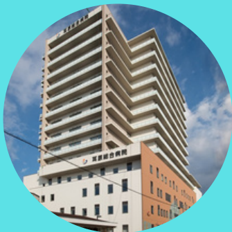
病院概要教育説明