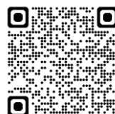
千葉ろうさい病院 看護部 QRコード