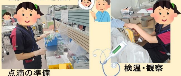
看護師の1日を紹介

病院内の現場で働く先輩の仕事を見てみませんか。 先輩と一緒にケアしてみませんか。