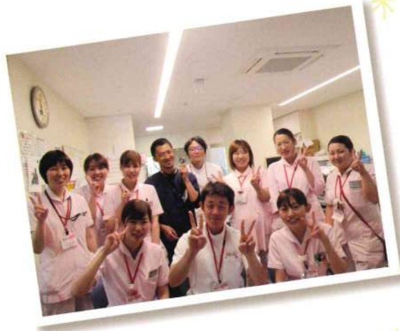
※全日本民生医療機関連合会の略称

「民医連」の病院として、無差別平等のもと、分け隔てのない医療・看護をすすめてきました。命の平等をつらぬき、差額ベッド料は一切いただいていません。また、治療費にお困りの方には、無料低額診療制度を活用し、お金がなくても安心して医療が受けられます。現在、大牟田市周辺の広範囲なエリアで2つの病院、3つの診療所1つの訪問看護ステーションなど、合わせて11カ所の医療・介護事業を運営しています。救急医療、在宅医療などにも取り組み、無差別・平等の地域包括ケアの実現を目指しています。