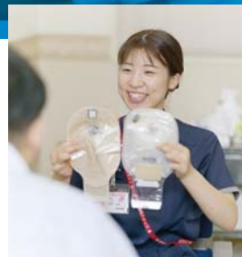
皮膚・排泄ケア 認定看護師