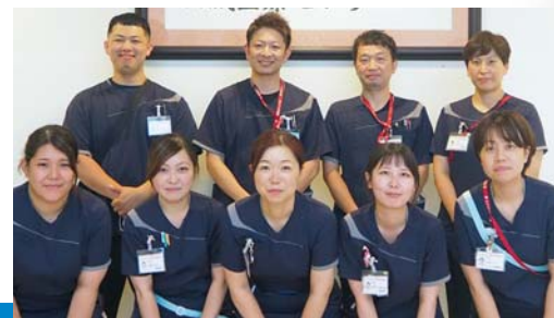
シミュレーションチームが、研修をサポートします