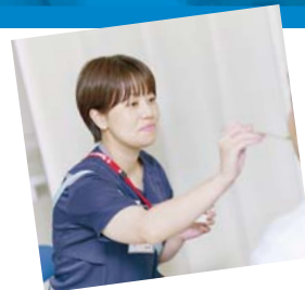
摂食・嚥下障害看護 認定看護師

日本看護協会認定看護師 専門看護師 特定行為研修への支援 認定看護管理者研修（ファースト・セカンド・サードレベル）アドバンス助産師 実習指導者講習会 医療安全管理者養成研修への支援 などキャリア開発に向けた制度が充実しています。