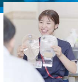
皮膚・排泄ケア 認定看護師