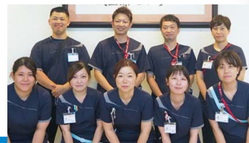
シミュレーションチームが、研修をサポートします

※デブリーフィング：学習者が行動を振り返り、 改善のための領域を議論し、新しい情報を以 前の知識に組み入れるための場