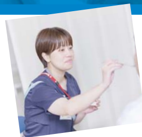
摂食・嚥下障害看護 認定看護師

日本看護協会認定看護師 専門看護師 特定行為研修への支援 認定看護管理者研修（ファースト・セカンド・サードレベル）アドバンス助産師 実習指導者講習会 医療安全管理者養成研修への支援 などキャリア開発に向けた制度が充実しています。