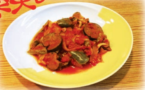
1人分84kcal・塩分1.1g・野菜150g 町田市民病院栄養科：杉山